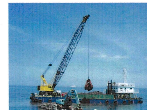
基礎石・被覆石撤去状況(イメージ)