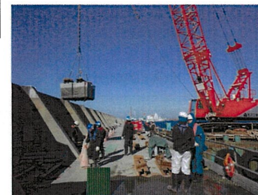
切断後コンクリート撤去状況(イメージ)