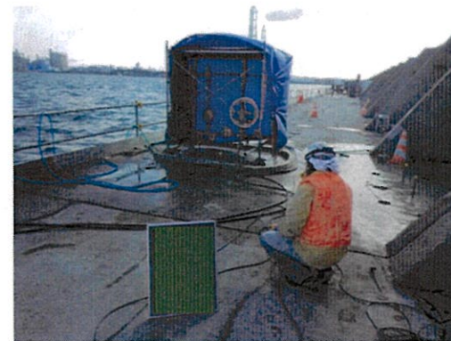
ワイヤーソー切断状況(イメージ)