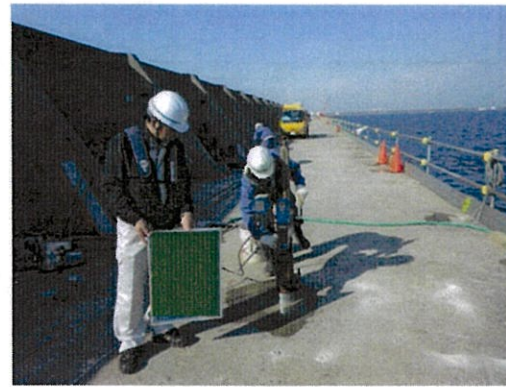
コア抜き状況(イメージ)