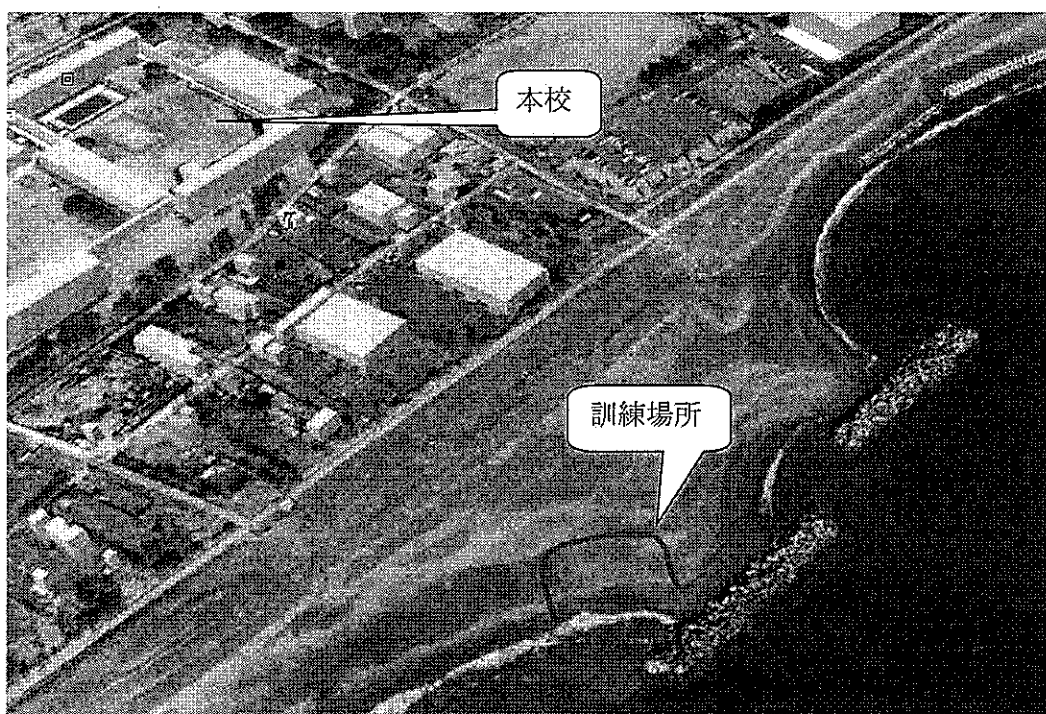
図1 救命信号装置取扱訓練場所